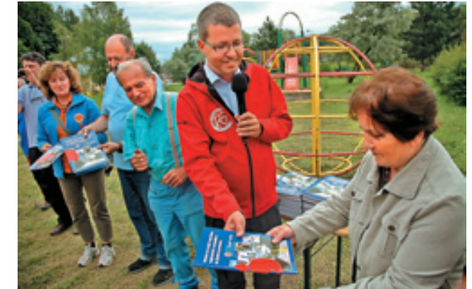
▲ Z krstu publikácie Arnošta Guldana Pohľad do dejín značenia turistických chodníkov na území Slovenska