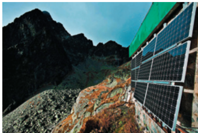
▲ Fotovoltaika na Téryho chate

* Malé vodné elektrárne sú závislé od prítoku vody turbínou. V prípade dlhotrvajúcich mrazov alebo sucha nie je možné zabezpečiť výrobu pomocou obnoviteľného zdroja a pre prevádzku chaty je nevyhnutné dočasne spustiť dieselagregát.