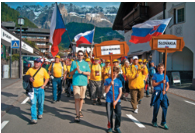
▲ Nástup olympionikov vo Val Gardene v Taliansku