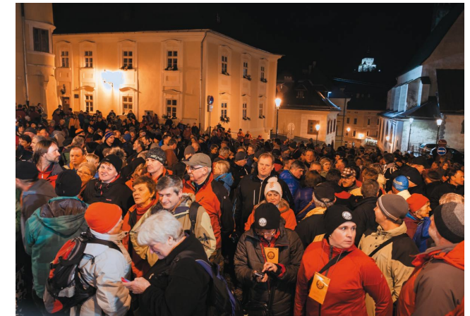
▲ Na hlavnom banskoštiavnickom námestí sa počas otvorenia zimného zrazu zišlo vyše tisíc účastníkov

Všetko zlé je na niečo dobré, teplé počasie návštevníkom doprialo lepšie spoznať Banskú Štiavnicu a jej okolie. Turistom, čo v týchto končinách ešte nikdy neboli, magické starobylé centrum baníckeho mesta priam