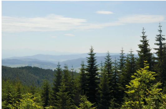
▲ Lesnícky náučný chodník J. D. Matejovie