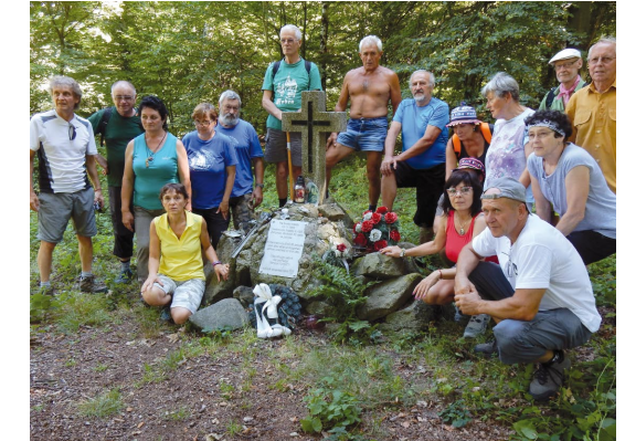
▲ Modranskí turisti pri pamätníku leteckej tragédie na Sakrakopci

Členovia Modranského turistického spolku (MTS) pravidelne cez víkend organizujú vychádzky do Malých Karpát. Program pochodu podrobne pripravuje Ľubomír Hubek, termín nástupu a trasa býva zverejnená na webovej stránke spolku.